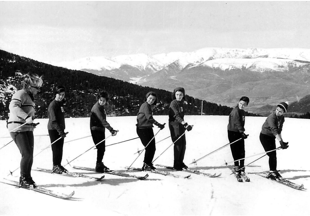
Esquiada a la Molina de l'Escola Betània.