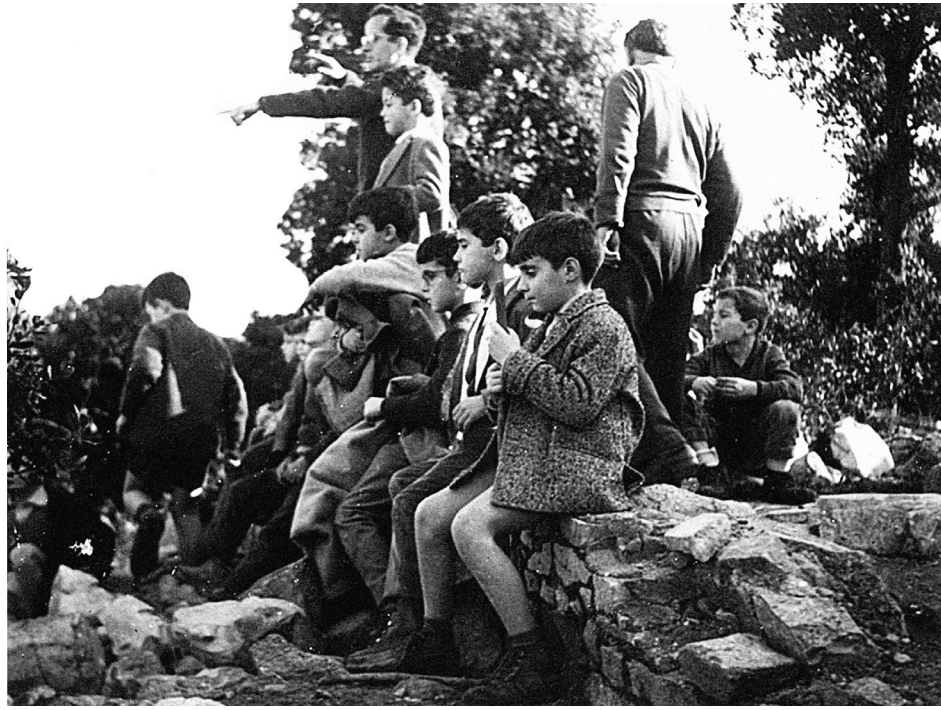
Grup d'alumnes de l'Escola Patmos.

L'1 d'octubre de 1959 era un dijous plujós. Aleshores el món estava dividit en dos bàndols que s'enfrontaven arreu del planeta i dues superpotències pretenien aconseguir el lideratge mundial i, per tant, la derrota del rival. A vegades el Primer Món, capitalista, lluitava contra el Segon Món, comunista; en altres ocasions, eren els soviètics els qui es barallaven amb els liberals. En aquell context estrany que basculava de la fredor a la combustió, i viceversa, va aparèixer un Tercer Món que s'alliberava del colonialisme occidental, però no de les cadenes de la pobresa.