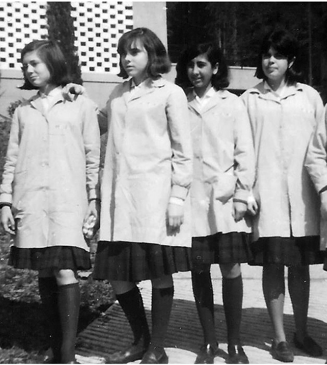
Grup d'alumnes de l'Escola Betània.